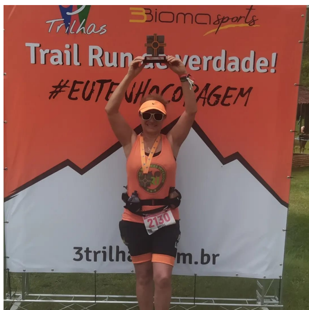
1º Lugar – Categoria – Corrida de Montanha