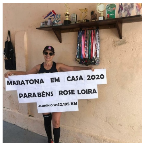
Troféus e Medalhas até 05/04/2020