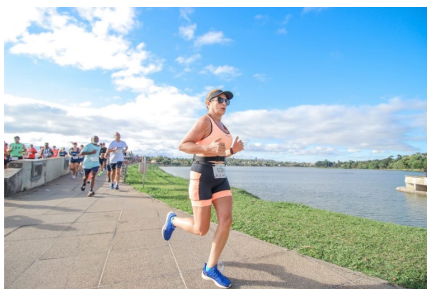
Volta Internacional da Pampulha - MG