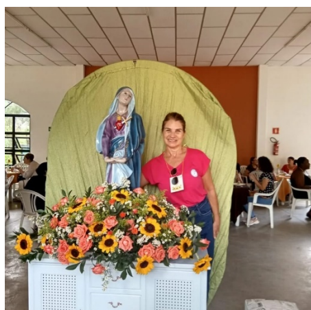
Servindo no Retiro para Mulheres