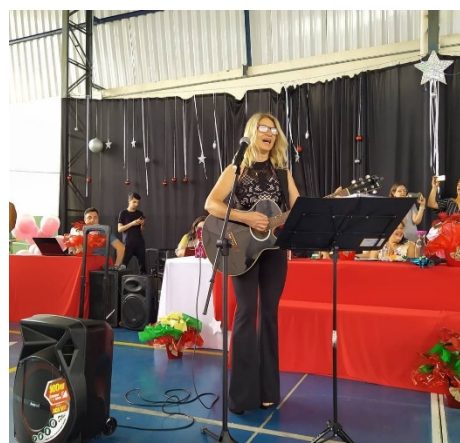
Tocando e cantando com os alunos - Formatura.