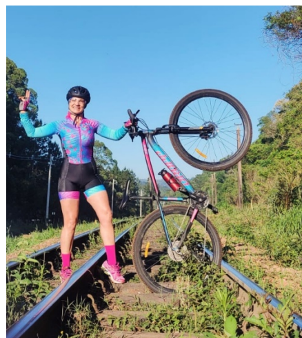
Treino de Pedal.