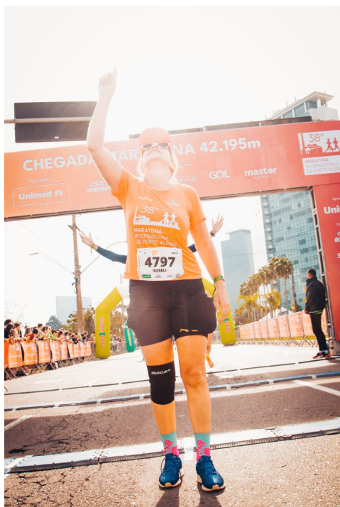
38ª Maratona de Porto Alegre - 2023