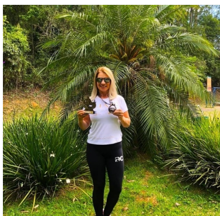
Troféu e medalha da Ultramaratona – 65 km