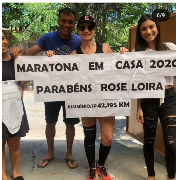
Maratona em casa, realizada em 05/04/2020