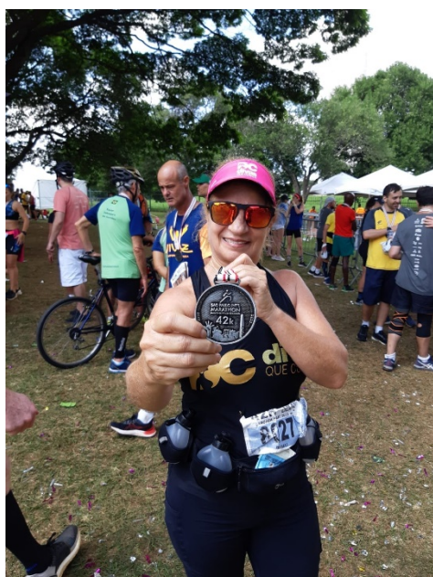
Maratona de São Paulo