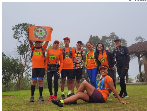
Grupo de Trilha – “Trail Runners Interior”